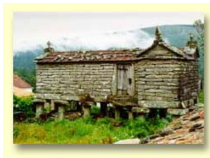
HÓRREOS: en xeral do século XVIII.