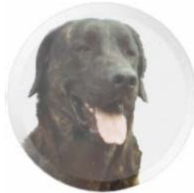
Can de Castro Laboreiro

"O POBRE NON TEN, O RICO NON DÁ", con este retrouso chamaba á súa gavela Tomás das Quingostas, o ladrón da Pena de Anamán. Debeu vivir na primeira metade do século XIX. A súa lenda latexa en Entrimo, polo Quinxo e o Gerés, os montes onde comeza a Galicia de Portugal. Tomás das Quingostas, dos camiños costaneiros, dos ermos de pedra onde só se escoita o ouveo do lobo. Respetaba á xente humilde e era fero cos poderosos. A raíña de Portugal mandou unha partida contra el. Déronlle morte. Leváronlle a cabeza e ela comentou: "se soubese que era tam bom moço não o mandaba matar". En Olelas, terra dos tocadores de concertina, cando un neno sae rabudo dinlle: "tu pareces Tomás das Quingostas". Xa non saben de quen falan pero saben que o neno é bravuno.